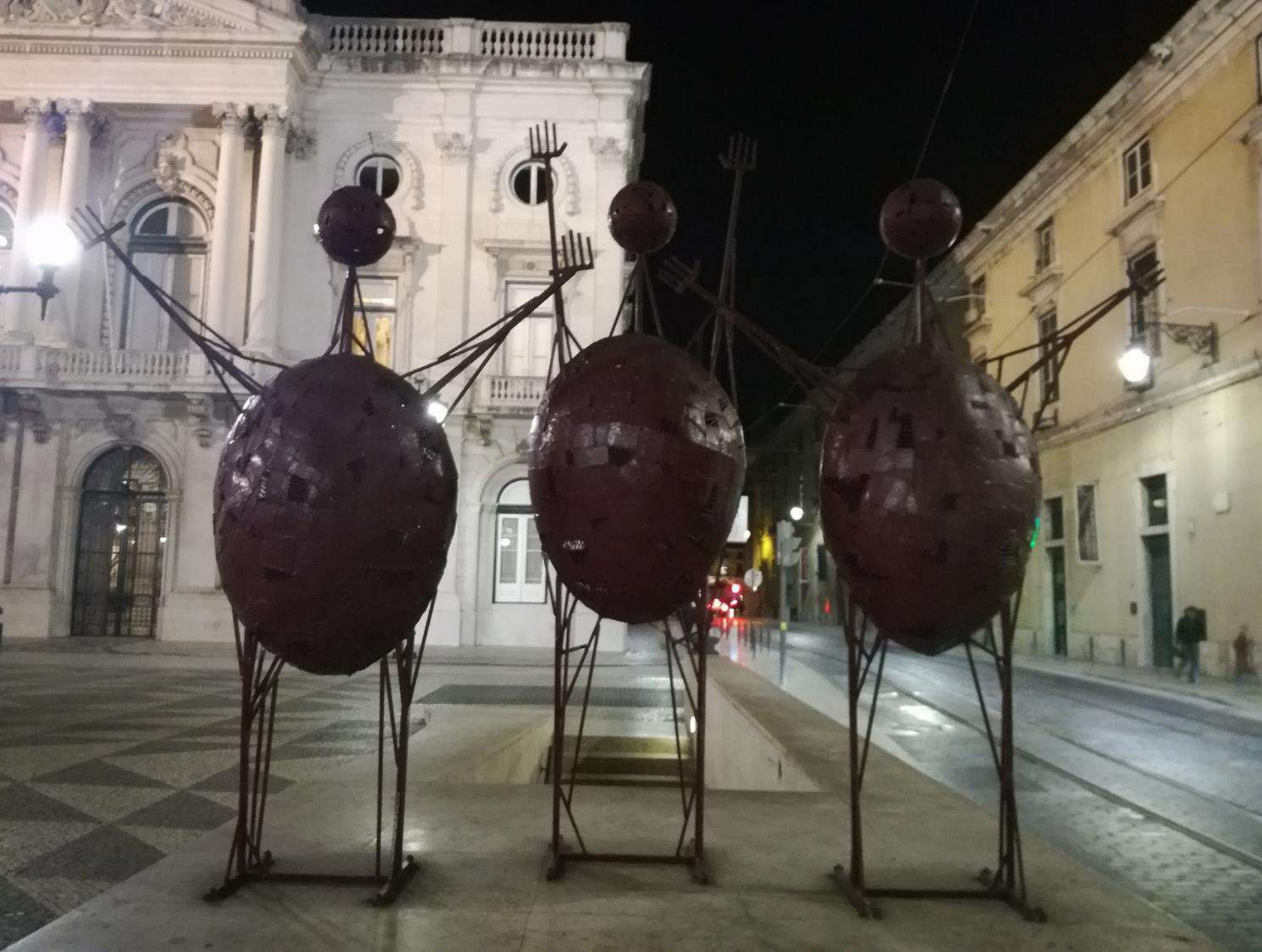
Praca do Municipio